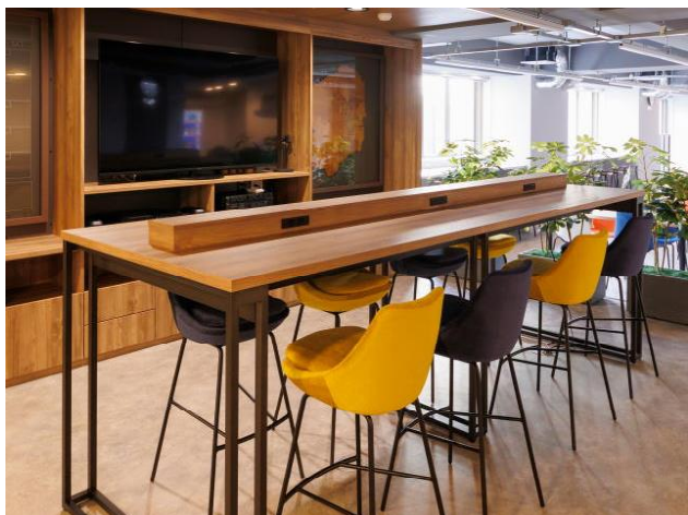
<エントランスラウンジ>